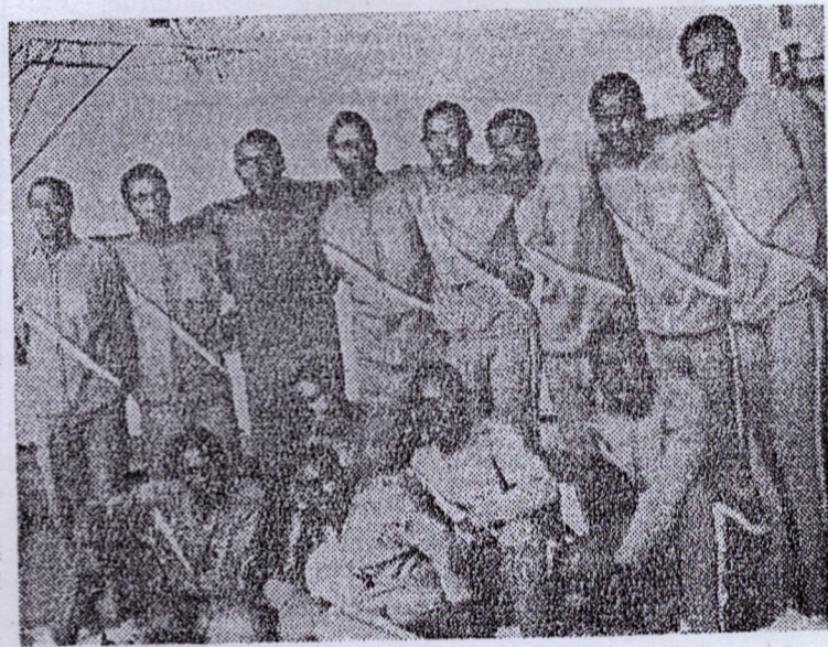
La sélection nationale de basket-ball.

Pour une meilleure préparation de ces rencontres,